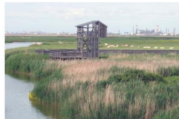
L'OBSERVATOIRE, TADASHI KAWAMATA, LAVAU-SUR-LOIRE © BERNARD RENOUX