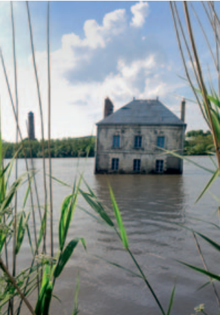
La Maison dans la Loire, Jean-Luc Courcoult