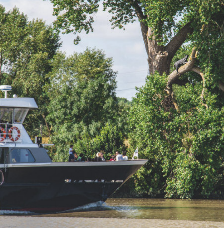
THE SETTLERS, SARAH SZÉ, BOUGUENAI © ADRIEN PASQUIER