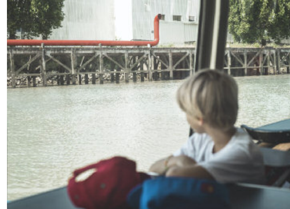
SERPENTINE ROUGE, JIMMIE DURHAM, INDRE

LES CROISIÈRES SONT COMMENTÉES PAR LES MEMBRES DU RÉSEAU ECOPÔLE, BRETAGNE VIVANTE ET ESTUARIUM ET LES GUIDES DU VOYAGE À NANTES.