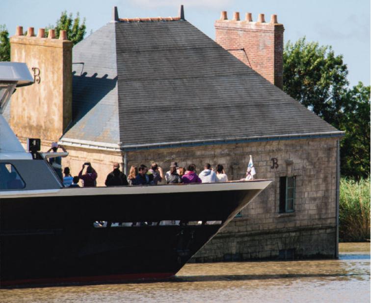
LA MAISON DANS LA LOIRE, JEAN-LUC COURCOULT. COUÉRON