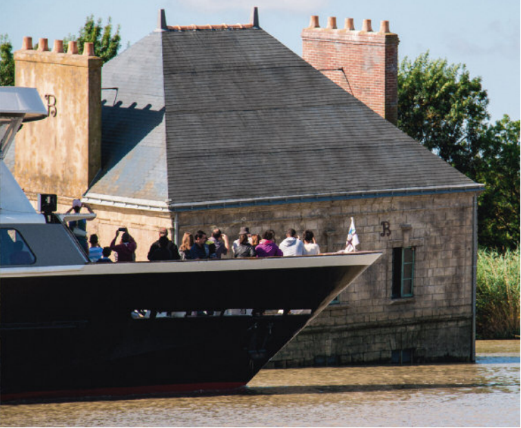
LA MAISON DANS LA LOIRE, JEAN-LUC COURCOULT. COUÉRON