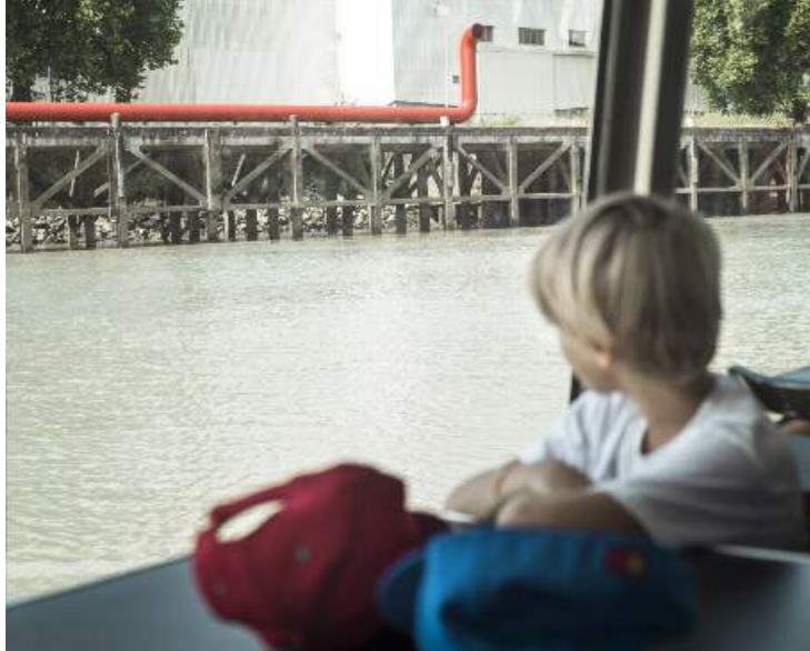
SERPENTINE ROUGE, JIMMIE DURHAM, INDRÉ